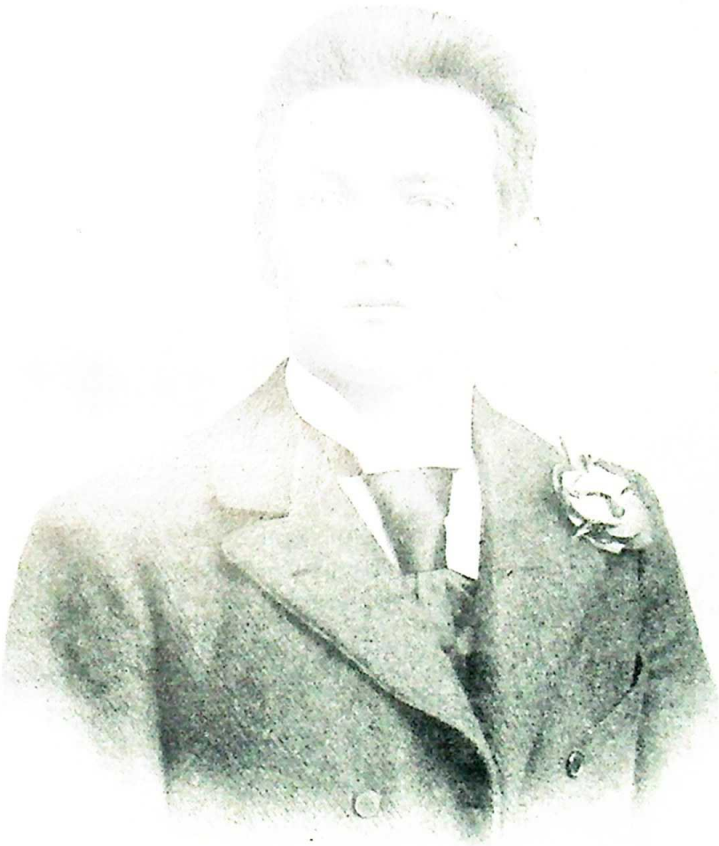
Wilhelm Pieck im Alter von 19 Jahren