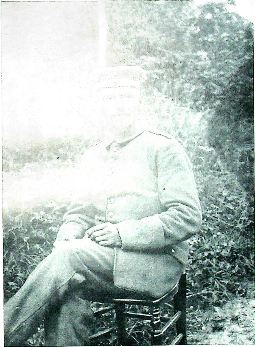
Wilhelm Pieck als Soldat im Juli 1916