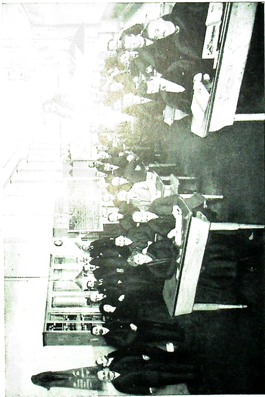
Zentrale Parteischule der SPD, Berlin 1907. Auf der 2. Bank der linken Seite: Wilhelm Pieck; stehend 4. von links: Rosa Luxemburg; 5. von links: August Bebel.