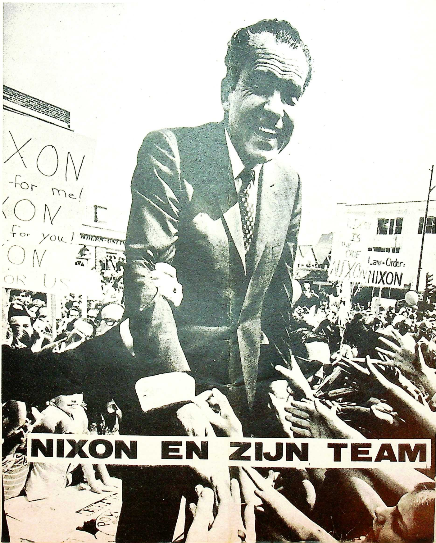
NIXON EN ZIJN TEAM