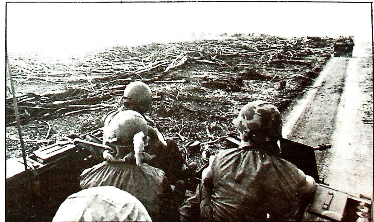
Rubberplantages langs route nr 7 in Cambodja na een Amerikaans artillerie-bombardement.