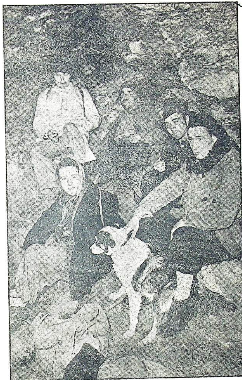
Gastarbeiders, op weg naar Zwitserland, overnachten in grotten.

Hoe begrijpelijk de Italiaanse verontwaardiging over de manier, waarop Italiaanse gastarbeiders in Zwitserland worden verongelikt ook is, de vraag mag gesteld worden of de Italianen niet op een soortgelijke wijze zouden reageren op de aanwezigheid van een verduidelijgend aantal buitenlandse arbeiderskrachten, die in Italië werk zouden komen zoeken. Van een bewust racisme kan in Italië niet worden gesproken, maar feit is dat Noorditalië over het algemeen ook vanuit de hoogste neerkijken op hun eigen landgenoten uit het zuiden en dat de woon- en levensomstandigheden van de binnenlandse emigranten uit Sicilië, Calabrië en de rest van het Mezzogiorno in en rond de Noorditaliaanse industriesteden zeker niet