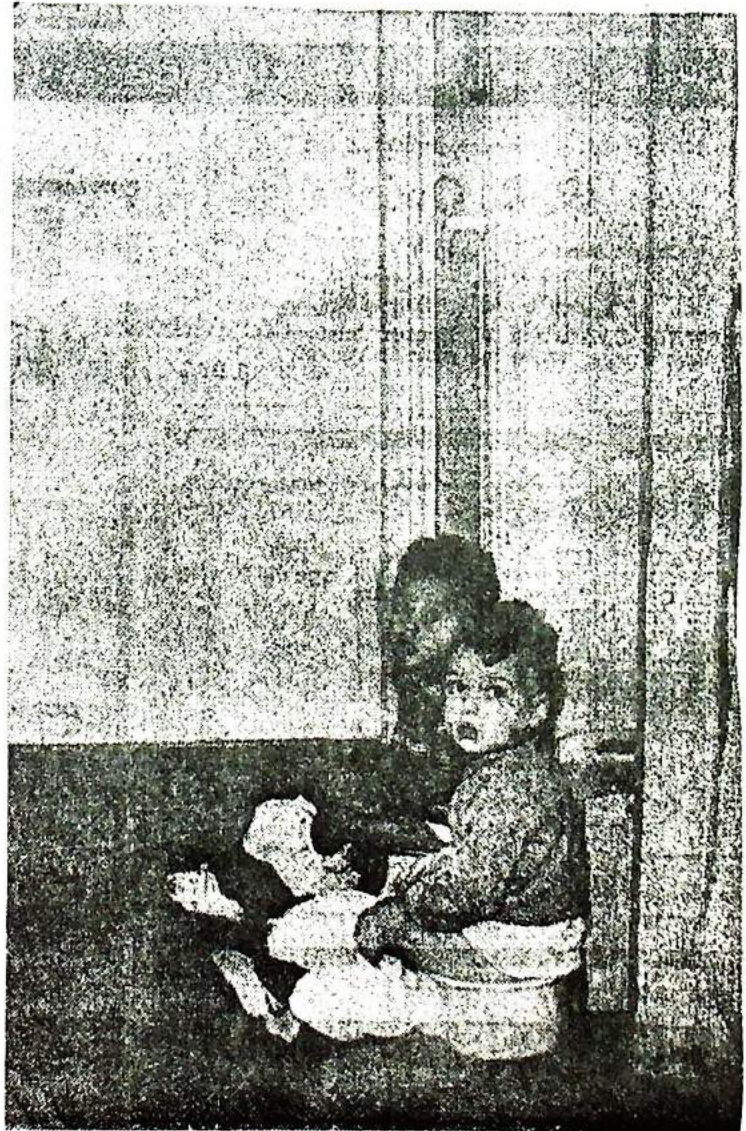
● Dit jaar nog geen 200 kinderen in pleeggezinnen opgenomen.

In het eerste programma, dat zondag 21 december wordt uitgezonden, komt een impressie voor van de aankomst op Schiphol van een aantal Koreaanse en Indiase adoptiekinderen. Maarten Nederhorst verwerkte daarin ook de opnamen, die hij maakte toen hij een week lang verbleef bij een Noordhollands gezin, dat vijf maanden geleden een Vietnamees meisje van vijf jaar kreeg. Haar moeder was een Vietnamese, haar vader een Amerikaanse negersoldaat. Haar moeder stierf, haar vader verdween. In haar geboorteland was zij een getekende; zij werd voortdurend nagewezen.