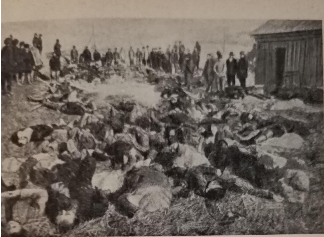
Slachtoffers van de schietpartij door Tsaristische troepen op de stakers in de Lena goudvelden