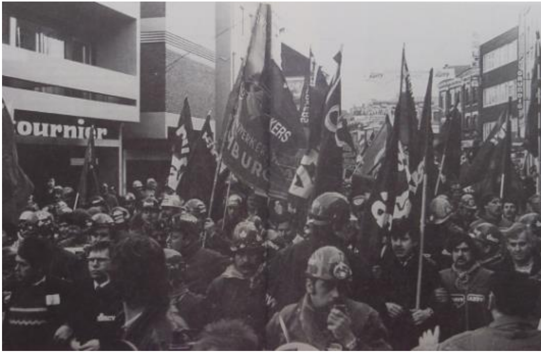
Hasselt, 12 april 1986