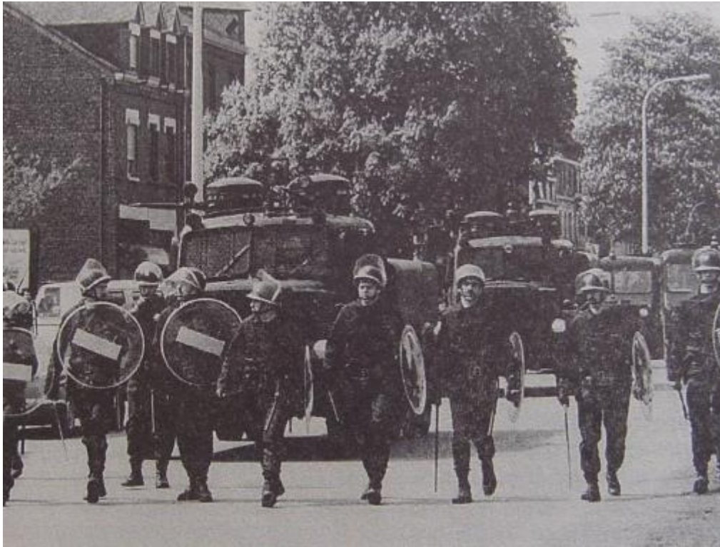
Waterschei, 14 mei 1986

Die nieuwe veldslag kwam er al zeer snel. Nauwelijks tien dagen later. En die leidde tot een schitterende overwinning, de overwinning van 6 juni.