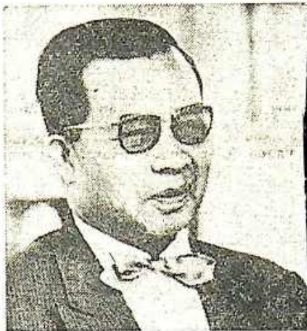
PRINS SOUVANNA PHOUMA ... géén staatsgreep ...

De premier van Laos, prins Souvanna Phouma, heeft besloten zijn tiendaags bezoek aan Frankrijk te be-