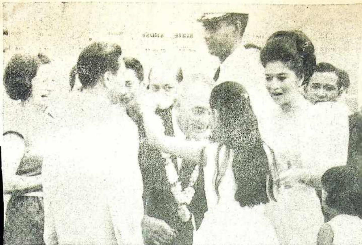
President Johnson wordt bij zijn aankomst in Manilla verwelkomd door president en mevrouw Marcos en hun beide dochters. Links mevrouw Johnson en tweede van links president Marcos (op de rug gezien). Deze hartelijke ontvangst stond in grote tegenstelling met de taferelen, die het presidentiële paar in Australië heeft meegemaakt.