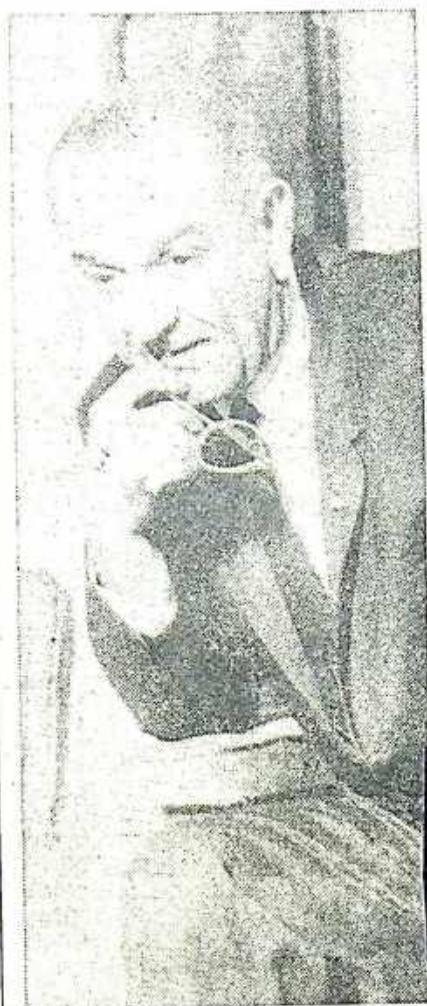
PRESIDENT JOHNSON ... reden tot bezorgdheid ...

Alhoewel er momenteel geen presidentsverkiezingen in zicht zijn, heerst er toch in de gelederen van de Democratische partij grote ongerustheid. Want in het najaar worden de tussentijdse verkiezingen voor Huis en Senaat gehouden, terwijl ook voor een aantal gouverneurs de ambtsperiode afloopt. En vele Democratische kandidaten zien deze verkiezing met grote bezorgdheid tegemoet. Nu is het normaal dat een tussentijdse verkiezing verlies oplevert