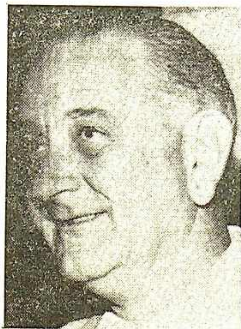
PRESIDENT JOHNSON ... minder populair ...

Hoewel de op een na de grootste bank in de Verenigde Staten, de Chase Manhattan, president Johnson te hulp gekomen is door de maatregelen van de