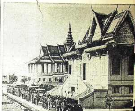
Het prinselijk paleis in Pnom Penh, de hoofdstad van Cambodja, waar president De Gaulle van 31 augustus tot 2 september zal logeren.