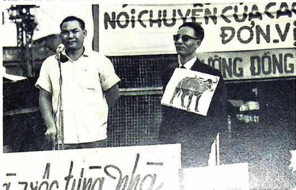
Campaigning in Saigon: A test of strength with the Communists?