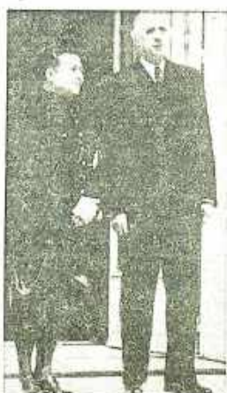
Prins Norodom Sihanouk, staats- hoofd van Cambodja, bij een be- zoek aan president De Gaulle in Parijs.

Vooral in Washington bestaat grote belangstelling voor het Franse staatsbezoek aan Cambodja, een staat die in mei vorig jaar de diplomatieke betrekkingen met Amerika heeft verbroken. Onlangs heeft Johnsons reizende ambassadeur, Averell Harriman, voorgesteld, dat hij in september naar Pnom Penh zou komen, maar prins Sihanouk is niet verlangend hem te ontvangen, vooral niet na recente incidenten met Amerikaanse bombardeeringen aan de over de Cambodjaanse grens. De Cambodjaans-Amerikaanse verstandhouding is nog bitterder slecht, terwijl Cambodja wel nauwe betrekkingen met