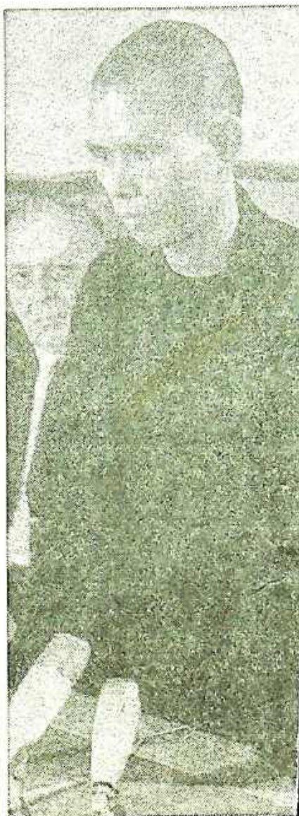
THICH NHAT HANH

Twee maanden geleden ging de monnik naar Amerika om gastcolleges te geven. Hij heeft daar echter ook gesprekken gevoerd met vooraanstaande politici, onder wie minister McNamara.