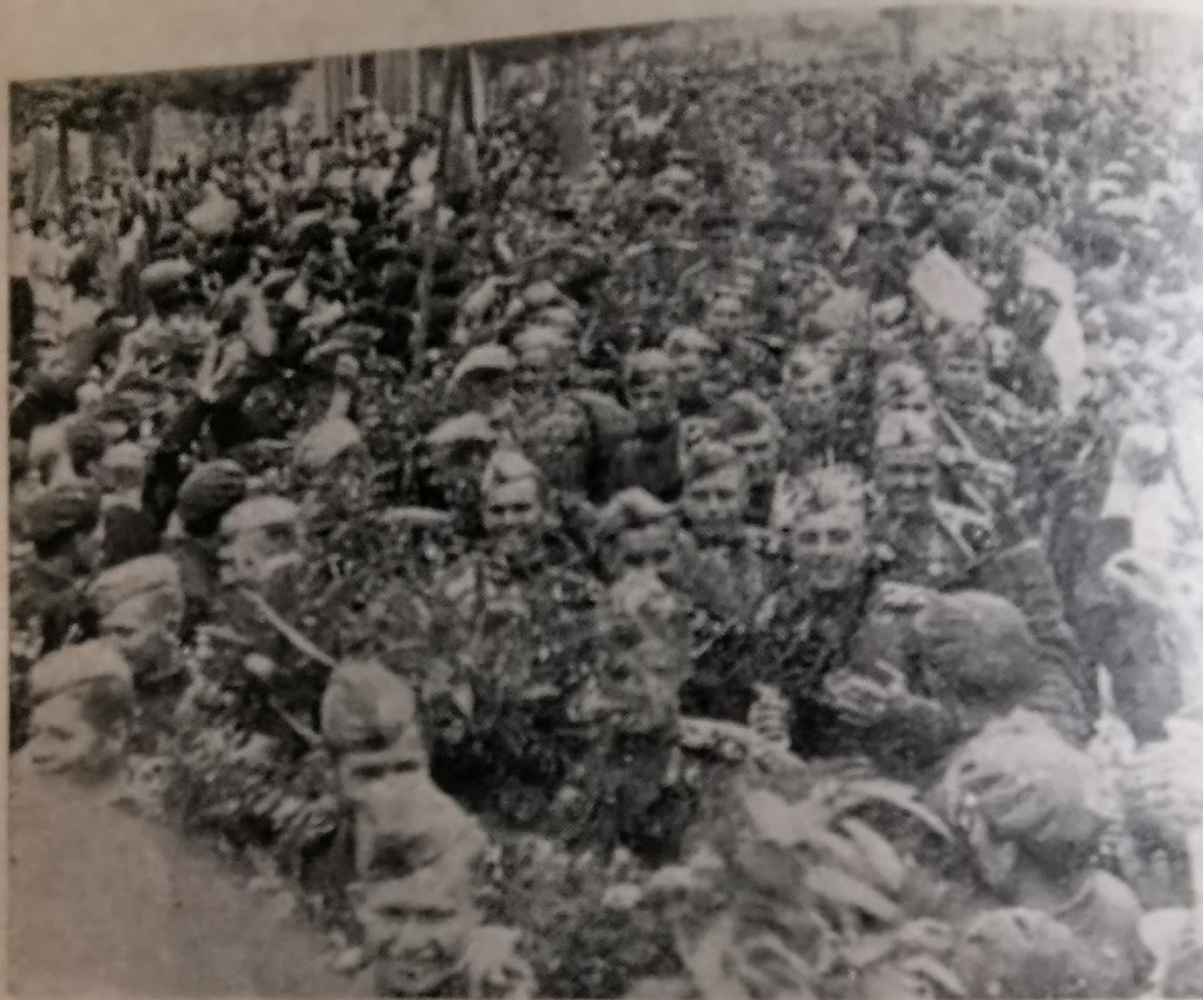
Vaarwel aan het Rode Leger. — De bevolking van Phyoongyang neemt in November 1948 afscheid van zijn bevrijders.

на, waarmee de soldaten reisden, werden onder bloemen bedolven. Boeren brachten geschenken en eetwaren naar de stations, waar de treinen stopten. Ze verwendden de soldaten met suri, een zelfgemaakte drank en poogden (haast met geweld) de soldaten toch maar één enkel cadeau in de handen te duwen. De Koreaanse boeren plegen elkaar te begroeten met „Sugo Hesimnida”. Dat betekent „Goed werk — goed gedaan.”