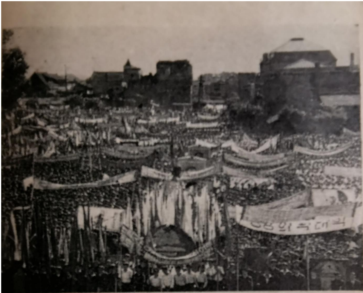
Massameeting in Phyoongyang ter gelegenheid van de vorming van het Vaderlandse front in Juni 1949.

PHYÖNGYANG is de hoofdstad van de Koreaanse volksdemocratische republiek. Midden door de stad stroomt de brede Daidong rivier, waarop tal van jonken varen. In Phyoongyang wonen 400.000 mensen wier stoutste dromen reeds verwezenlijkt zijn of in de allernaaste toekomst werkelijkheid zullen worden. Want in hun republiek wordt een nieuwe, schone toekomst vóór de Koreanen en dóór de Koreanen gebouwd.