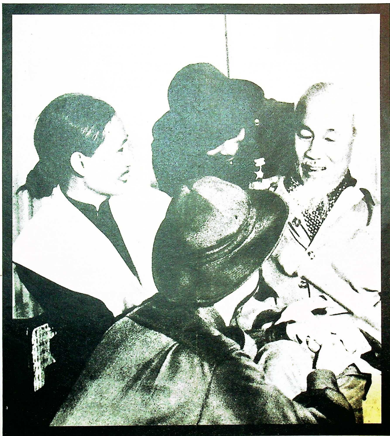
HO TSJI MINH temidden van strijders uit het Zuiden