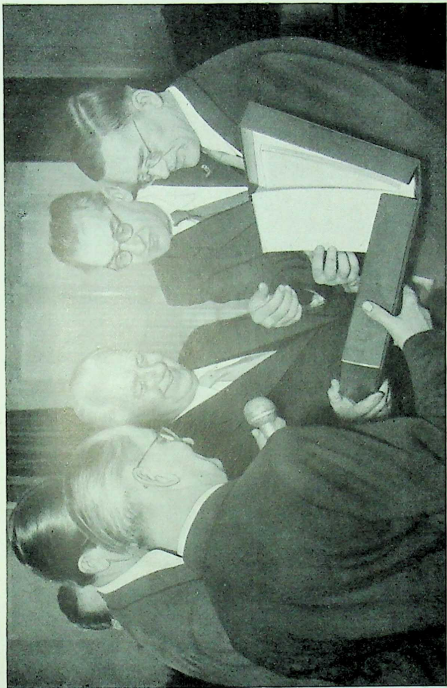
Zum 75. Geburtstag wurden dem Präsidenten Wilhelm Pieck durch Delegationen befreundeter Länder und ausländischer Bruderparteien zahlreiche Geschenke überbracht. Hier überreicht die polnische Delegation dem Präsidenten eine Kassette mit Originaldokumenten aus dem heroischen Kampf der Kommunistischen Partei Deutschlands