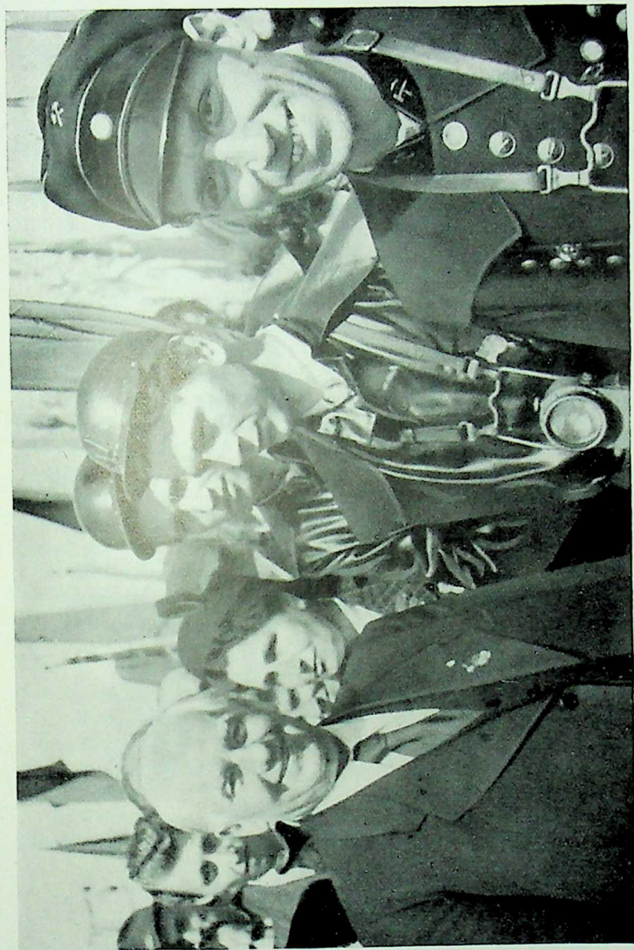
Präsident Wilhelm Pieck während der Maikundgebung 1951 in Chemnitz (jetzt Karl-Marx-Stadt) im Gespräch mit Kumpeln aus dem Erzbergbau