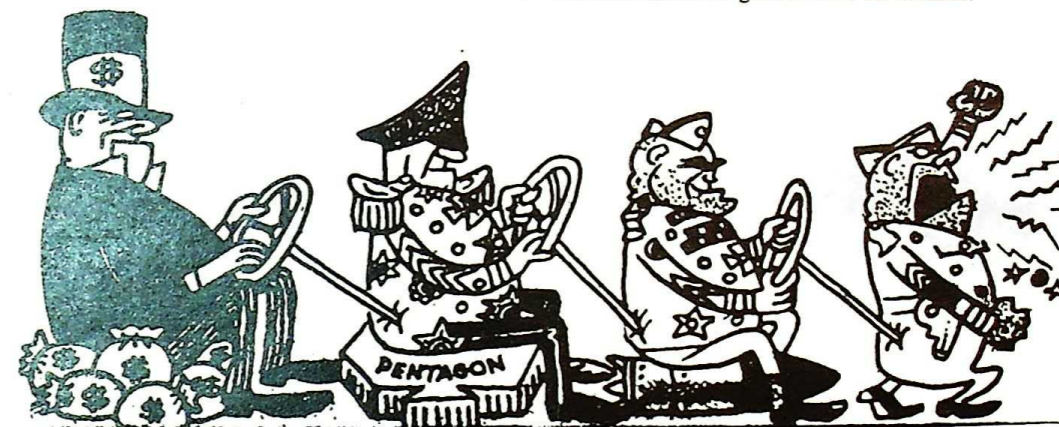
De militaire machine gezien door de soldaat.

De morele tweestrijd, die een gevolg is van het bestaan van de deserteurs, zal niet makkelijk op te lossen zijn. Maar, zoals een jonge deserteur zei, toen de problemen naar voren gebracht werden: 'Je begint met de oorlog. Is die te rechtvaardigen, dan klopt één serie antwoorden. Is hij dat niet, zoals ik denk, dan heb je iets heel nieuws.'