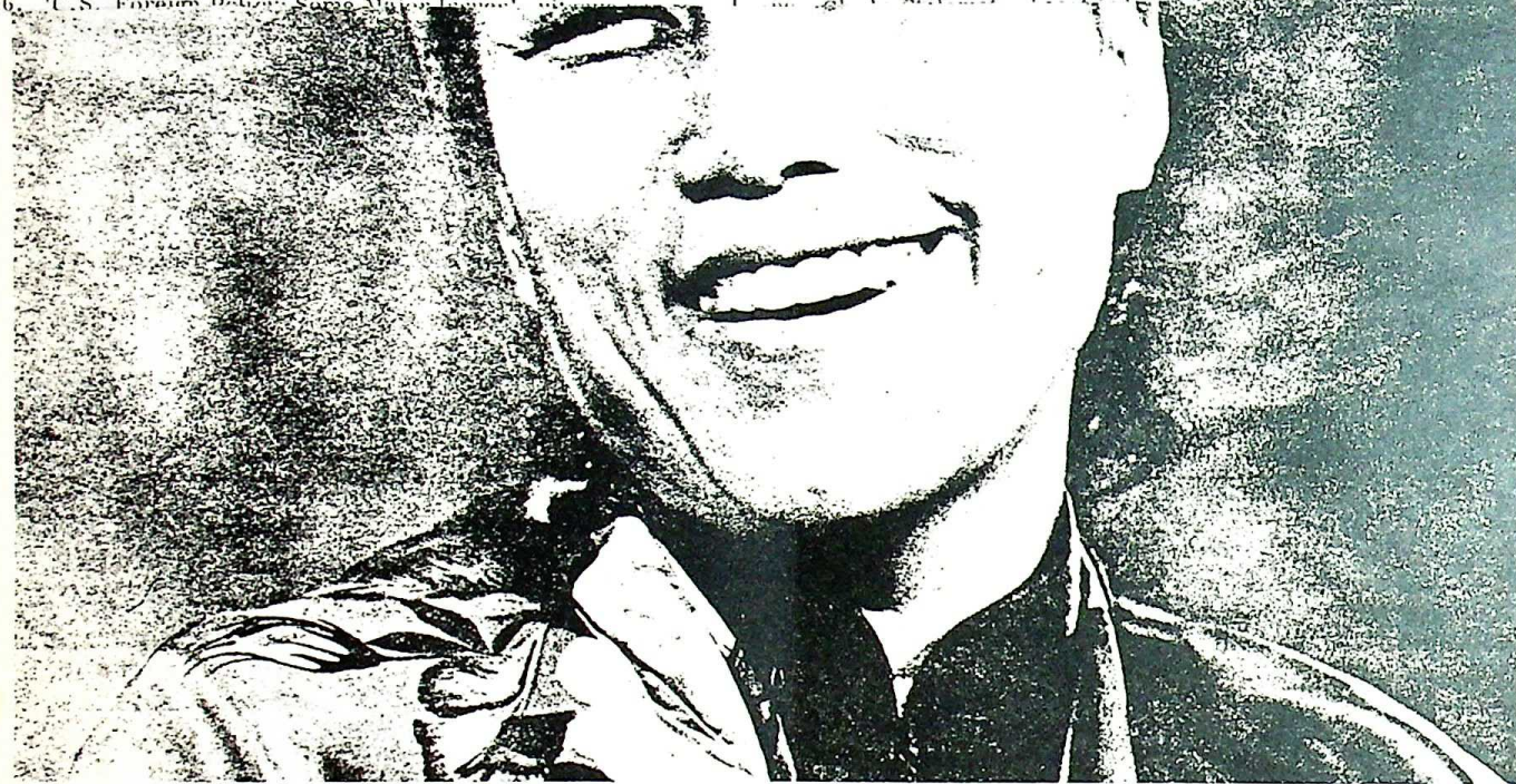
Madame Nguyen Thi Binh

barken. De overlevenden die er in slaagden de kust zwemmend te bereiken werden afgemaakt met geweerkogels. Slechts 1 van de 1200 overleefde het. Honderden lijken werden de volgende dagen aan de kusten van Sa Ky en Phu To, provincie Quang Ngai gevonden.