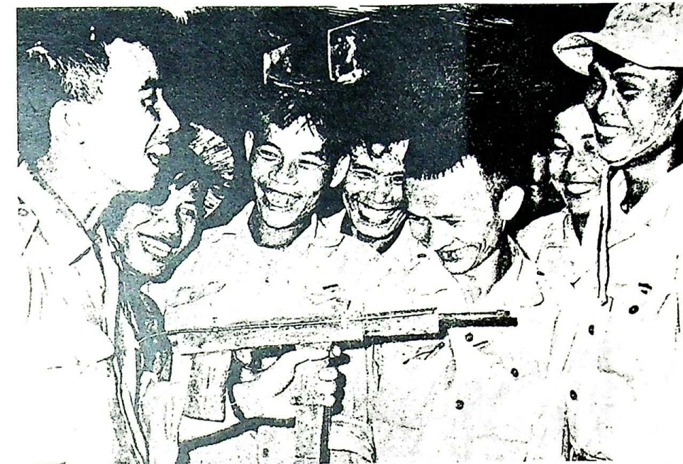
Bevrijdingsfrontstrijder toont vrienden namaakgeweer waarmee het hem gelukt is Saigon-post te overmeesteren

se-systeem erin na het Tet-offensief de meeste van hun 'veilige' dorpen te behouden - op papier. Het probleem is nog ingewikkelder. Wanneer een Amerikaan arriveert, en vragen stelt over het NBF, weten de dorpsbewoners dat als zij de waarheid vertellen, het Amerikaanse leger waarschijnlijk later een aanval zal doen, en ze even waarschijnlijk zal vernietigen. Vanzelfsprekend zijn ze geneigd de 18 gestelde vragen bevestigend te beantwoorden. Deze vragen worden gelijk gewaardeerd, zodat zelfs als er militaire eenheden en een infrastructuur van het NBF volledig aanwezig zijn, de Amerikanen het dorp nog als 'absoluut zeker' of 'veilig' waarderen. Aangezien de Amerikaanse beoordeler bovendien ook verslag uitbrengt van het