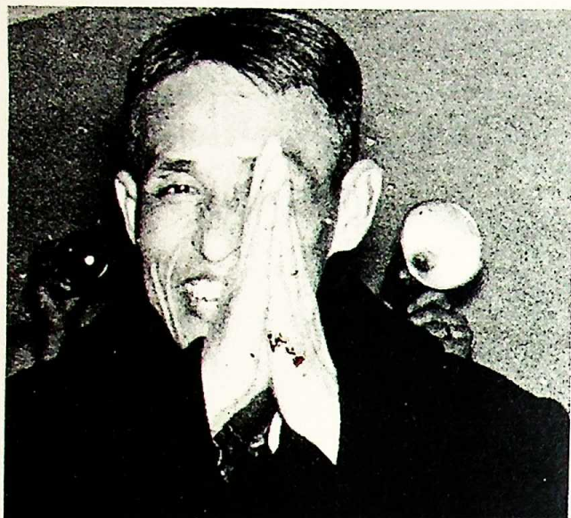
Fran Buu Kiem, hoofd van de Bevrijdingsfrontsdelegatie bij de besprekingen in Parijs

Op basis van het politieke programma en de vijf punten van het Nationale Bevrijdingsfront van Zuid-Vietnam, dat eveneens in aanmerking neemt het 4-punten standpunt van de regering van de Democratische Republiek Vietnam;