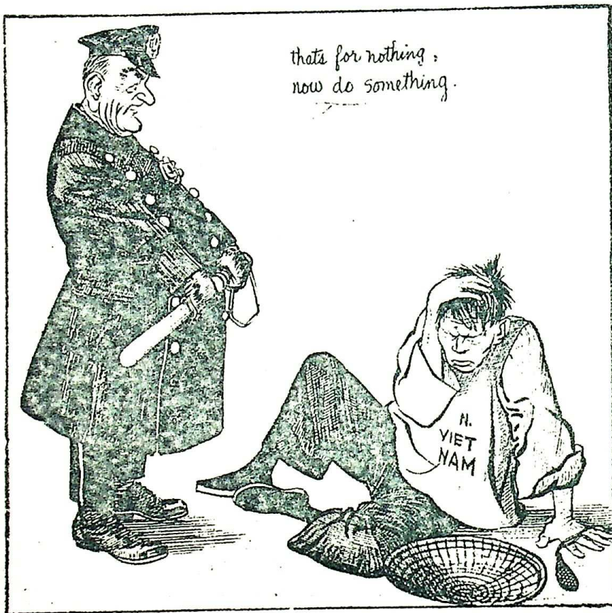
M. J. Nelson, Toronto Star

We weten thans niet, hoe het Bevrijdingsfront is samengesteld, maar het lijkt waarschijnlijk, dat het een afspiegeling is van de grote variëteit van politieke machten in de oppositie. Op het ogenblik is de meerderheid van de oppositie tegen Diem nog anti-communistisch. De bevolking heeft nog slechts een geringe sympathie voor het communisme."