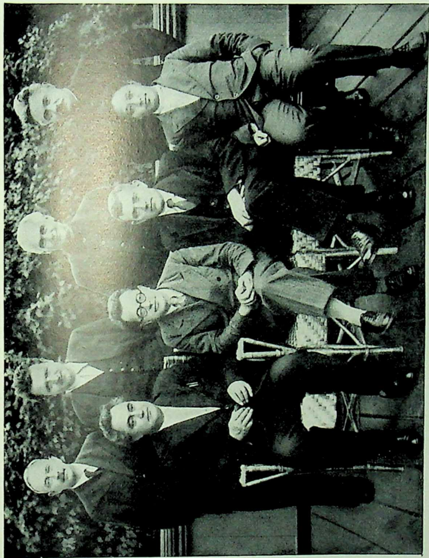
Wilhelm Pieck im Kreise anderer Mitglieder des Exekutivkomitees der Kommunistischen Internationale im Jahre 1936. Auf dem Bild stehend: Kuusinen, Gottwald, Pieck, Manuilski; sitzend: Dimitroff, Togliatti, Florin, Wan Min.