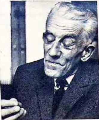
„Als ik ooit moet kiezen... zal mijn geweten voorgaan.”

weest. Ik heb daar een medaille ge- kregen in verband met mijn aandeel in de februaristaking. Ik heb gezegd: ik ben ontzettend blij met die medail- le, maar als ik ooit moet kiezen tus- sen die medaille en mijn geweten, zal mijn geweten voorgaan! En nu die Hongaarse opstand. Dat was voor mij een heel klein beetje een vergelijkbare zaak. Dat wil alleen maar zeggen: ik voelde me toen niet in staat de situatie zo snel te beoor- delen. Ik wist één ding: Hongarije had met de Duitsers samengehouden. Die gedachte heeft bij mij in 1956 wel degelijk meegespeeld. Ik moest reke- ning houden met de mogelijkheid dat er mensen waren die niet altijd uit eerlijke motieven handelden. Boven- dien vond ik het allemaal wat te spectaculair. „Het Parool” bijvoor- beeld schreef in die dagen dat het bord „Staliniaan” hier in Amsterdam op demonstratieve wijze moest wor- den aangehaald. Zo iets vind ik on-