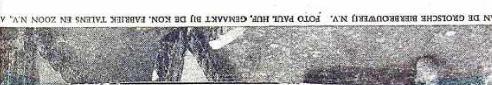
Lelio Basso over agressie en genocide