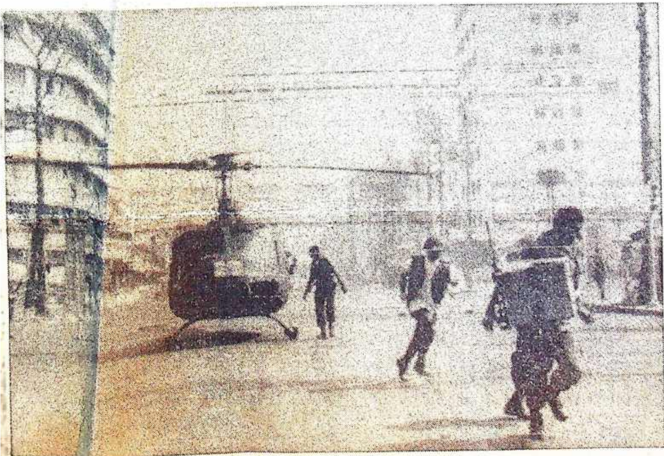
Amerikaanse helikopters landden gisteren, tijdens de gevechten in Saigon, niet alleen op het dak van de Amerikaanse ambassade, maar ook in de straten van de stad. Een Amerikaanse soldaat rent hier met een doos bloed, die door een wentelwiek is aangevoerd; een van zijn gewonde strijdmakkers heeft dringend een transfusie nodig.