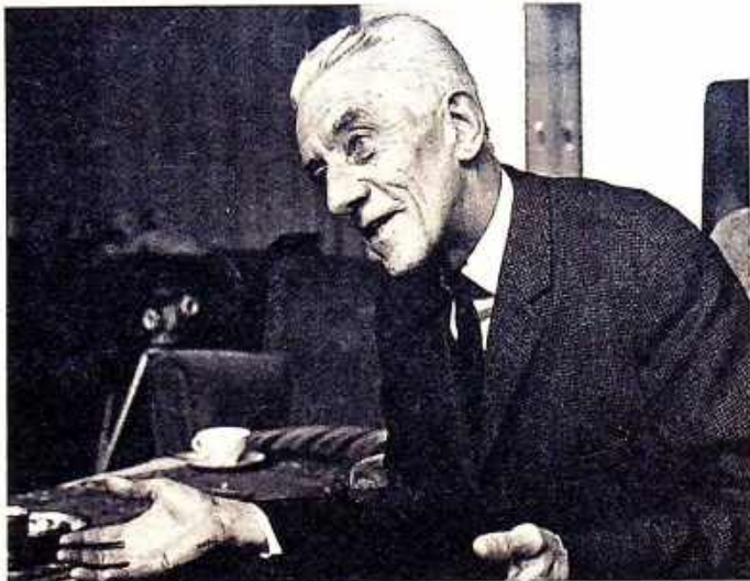
„En ik voelde: ik moet iets doen wil ik zelf volwaardig mens blijven.“