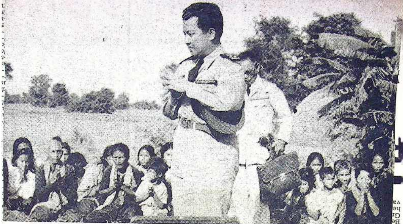
Prins Norodom Sihanouk van Cambodja