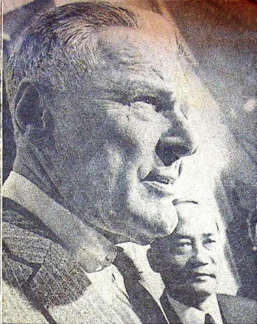
Henry Cabot Lodge, leider van de Amerikaanse delegatie bij de vredesbesprekingen in Parijs, heeft gisteren gesproken met de Zuidvietnamese ambassadeur in Parijs, Pham Dang Lam (r.)