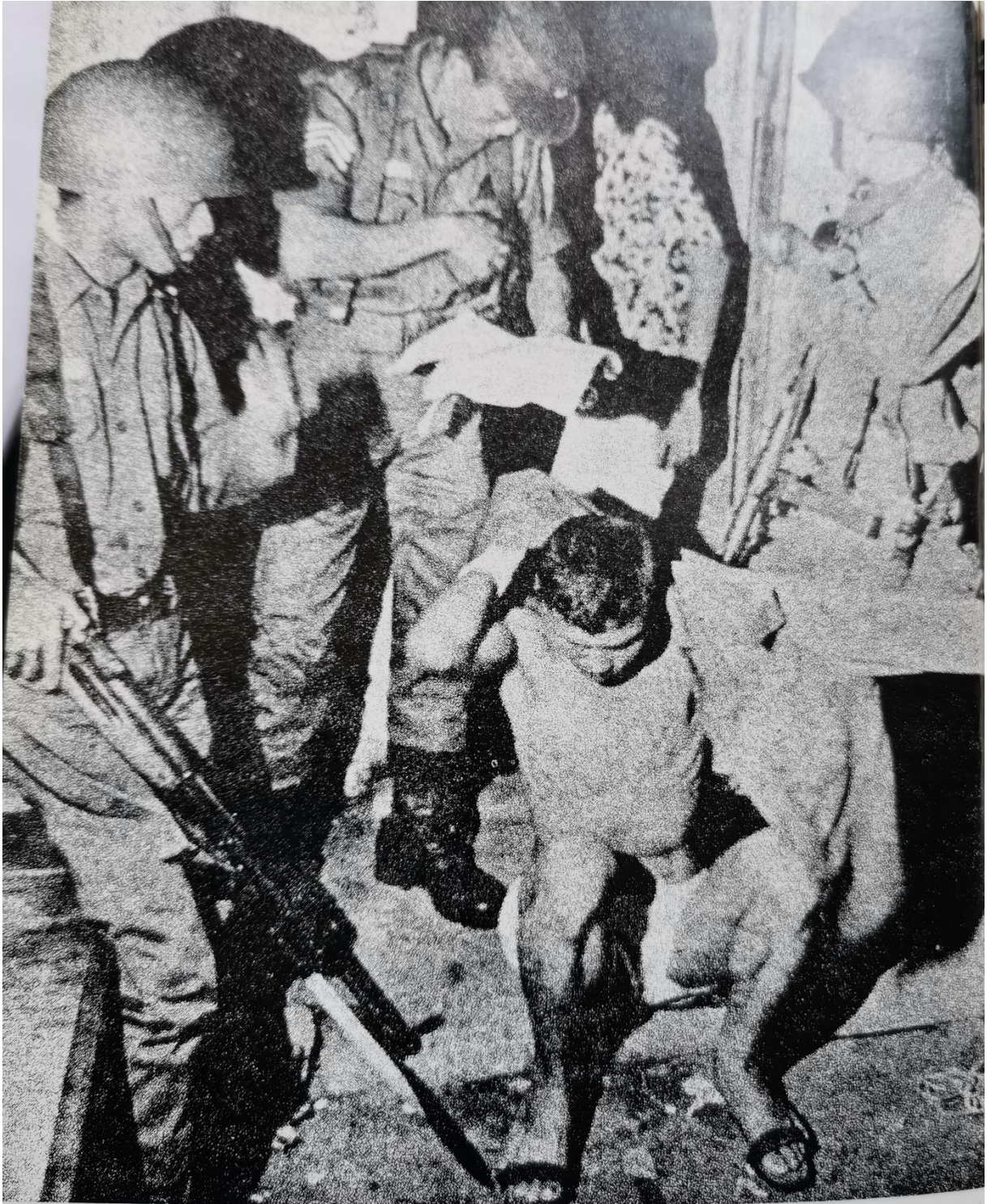
Winter 1965 — Nachtelijke overvallen en massale executies door de leden van Nasutions speciale legeronderdelen.