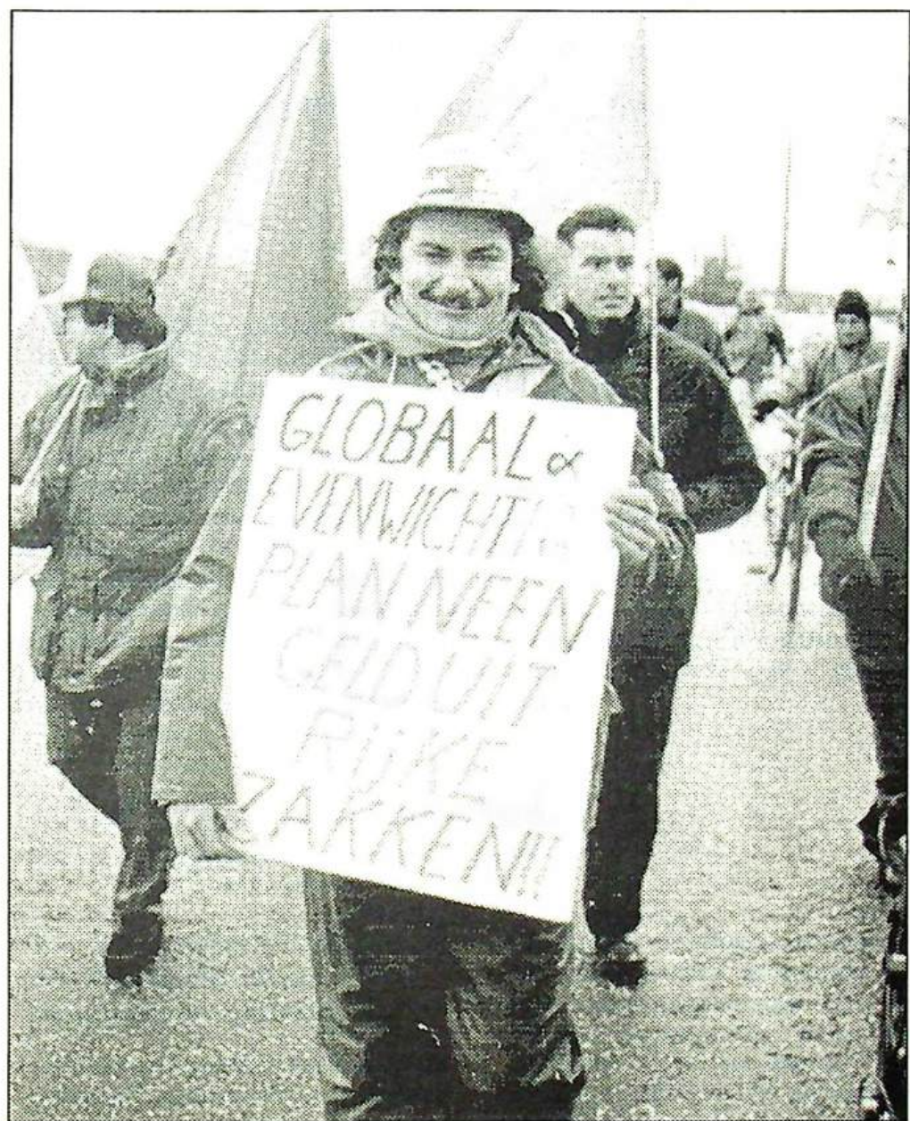
Het sociaal-economisch programma van het Vlaams Blok is een ramp voor de werkers. Elke vorm van klassestrijd, zoals de stakingen tegen het Globaal Plan in 1993, wil het Blok onmogelijk maken. Racisme en nationalisme verdeelt de werkers en laat het grootkapitaal buiten schot.